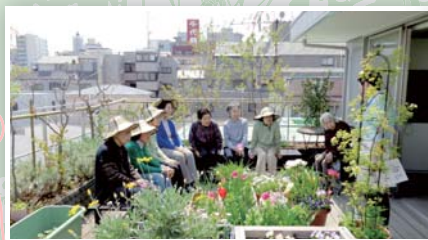
▲ 植物勉強会 ▼ 室内園芸